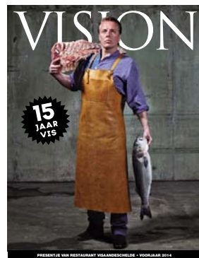
Special restaurant Visaandeschelde

De reguliere oplage van Vision bedraagt 10.000 exemplaren.