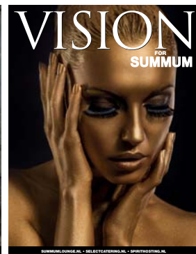
Special Summum Lounge Schiphol-Oost